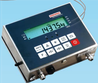
Indicator type 3010 in roestvast stalen, IP65 dichte behuizing