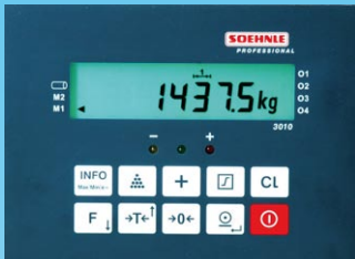
Frontpaneel met toetsen en display met achtergrondverlichting