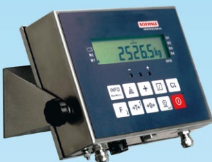
Indicator met wand console